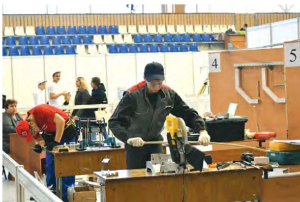
Региональный чемпионат «Молодые профессионалы» в г. Тольятти.

3. Продолжается реализация приоритетного национального проекта «Рабочие кадры для передовых технологий», которым предусматривается увеличение к концу 2020 года до 50 тыс. человек численности выпускников образовательных организаций, реализующих программы СПО, продемонстрировавших уровень подготовки, соответствующий стандартам Ворлдскиллс Россия.